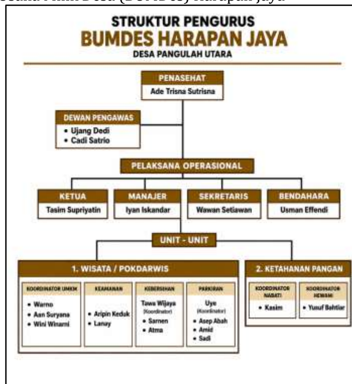
Gambar 1 Struktur Organisasi BUMDes Harapan Jaya

Struktur Badan Usaha Milik Desa (BUMDes) Harapan Jaya