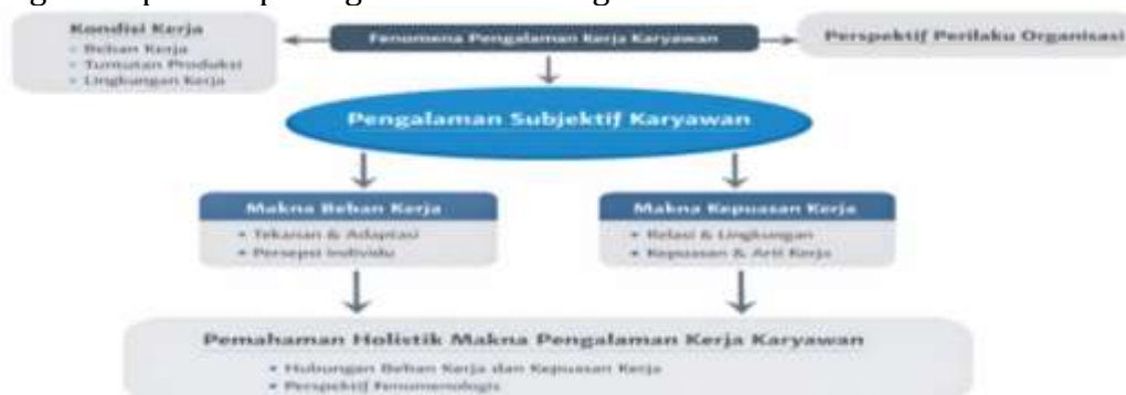
Gambar 1. Kerangka Berpikir

Kerangka berpikir dapat digambarkan sebagai berikut: