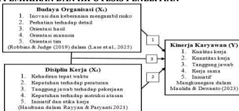
Gambar 1. Paradigma Penelitian