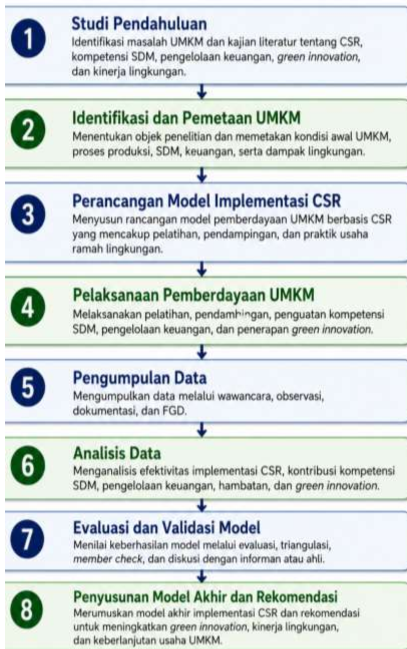
Gambar 2. Alur Kegiatan

Penggunaan data primer dan sekunder, pemilihan populasi pada sektor UMKM produksi, serta penentuan sampel dan informan secara purposif memperkuat relevansi penelitian dengan fenomena yang dikaji. Penelitian ini tidak hanya menempatkan UMKM sebagai objek ekonomi, tetapi juga sebagai aktor penting dalam pembangunan berkelanjutan yang dituntut mampu mengelola sumber daya, mengurangi dampak lingkungan, dan menciptakan inovasi hijau. Dengan demikian, rancangan metodologi ini menjadi fondasi yang kokoh untuk menghasilkan temuan yang tidak hanya valid secara akademik, tetapi juga bermakna secara praktis bagi pengembangan UMKM yang lebih adaptif, inovatif, dan peduli lingkungan