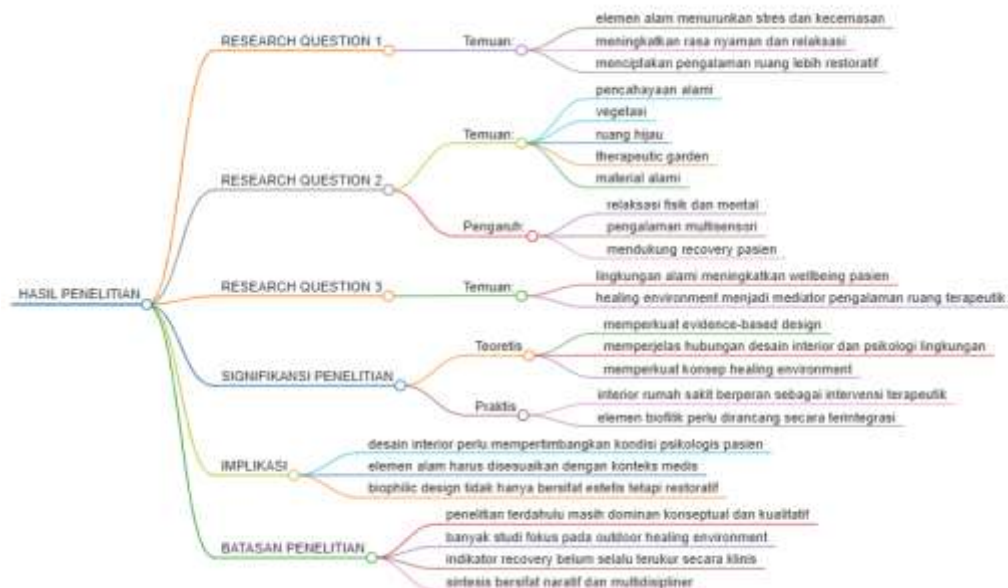
Gambar 3. Sintesis Konseptual Hasil Penelitian tentang Biophilic Design pada Interior Fasilitas Kesehatan

berfokus pada ruang luar, dan belum seluruhnya mengukur stres serta recovery secara langsung. Penelitian lanjutan perlu menggunakan desain empiris yang lebih terukur dalam konteks interior fasilitas kesehatan.