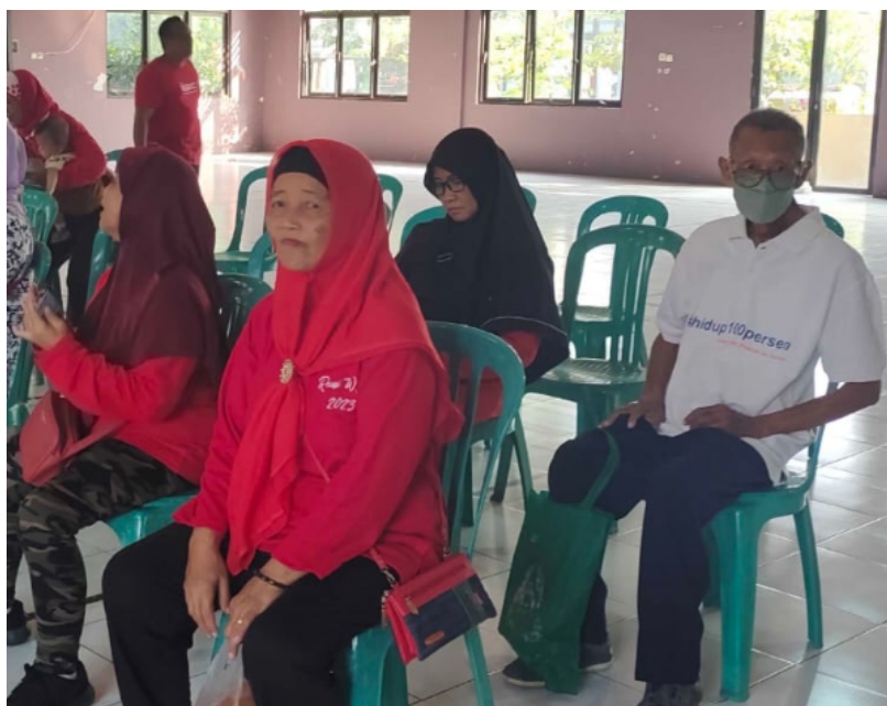
Gambar 5. Kegiatan POSYANDU 2