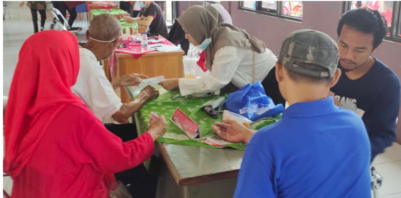
Gambar 4. Kegiatan POSYANDU 1