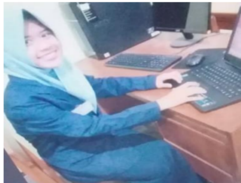
Gambar 3. Pelatihan dan Pendampingan Bagi PKK Dawis Tomat