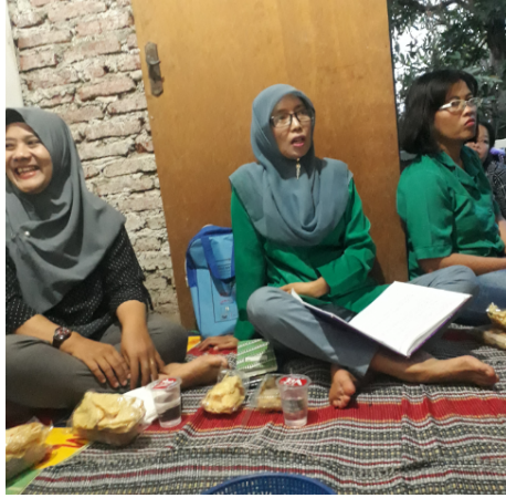
Gambar 2. PKK Dawis Tomat