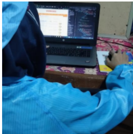
Gambar 4. Pelatihan dan Pendampingan Bagi PKK Dawis Tomat