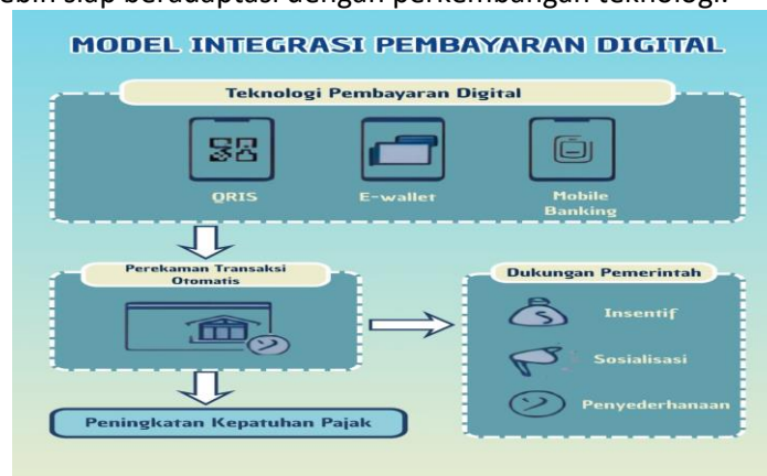
Gambar 3. Model Pembayaran Digital dalam Meningkatkan Kepatuhan Wajib Pajak

Pasar Butung di Makassar merupakan salah satu pusat perdagangan terbesar di kawasan timur Indonesia. Ribuan pelaku UMKM beroperasi di sana, dengan kontribusi signifikan terhadap perekonomian local, perputaran ekonomi, penciptaan lapangan kerja, serta aktivitas perdagangan masyarakat. Kondisi ini menunjukkan bahwa Pasar Butung tidak hanya berfungsi sebagai tempat jual beli, tetapi juga sebagai pusat pertumbuhan usaha kecil dan menengah yang sangat strategis. Namun, tingkat kepatuhan pajak UMKM masih menghadapi tantangan, terutama terkait rendahnya literasi keuangan dan keterbatasan penggunaan teknologi pembayaran digital. sehingga pemahaman mereka tentang pencatatan keuangan, pengelolaan usaha, dan kewajiban perpajakan masih terbatas. Selain itu, penggunaan teknologi pembayaran digital juga masih belum maksimal, padahal teknologi tersebut dapat membantu mempermudah transaksi, pencatatan pemasukan, dan pelaporan pajak. Oleh karena itu, diperlukan upaya edukasi dan pendampingan agar UMKM dapat lebih patuh pajak dan lebih siap beradaptasi dengan perkembangan teknologi.