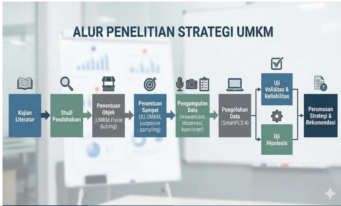
Gambar 1. Diagram alir penelitian strategi UMKM